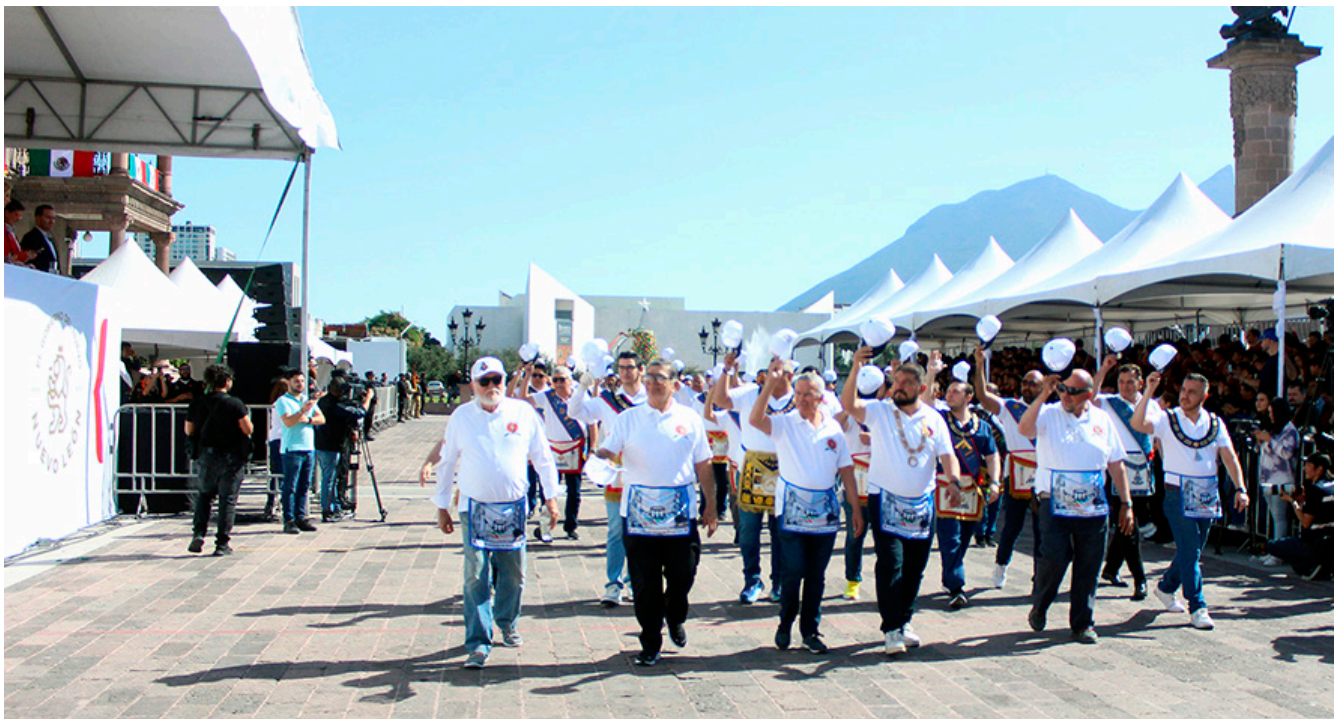
Encabezados por el gran maestro de la Gran Logia y los exgrandes maestros; el contingente saluda a las autoridades civiles y militares al pasar frente a ellas en el palco del palacio de gobierno. Texto: el autor.

Ante la sorpresa de cientos de asistentes, ahí estaban los míticos masones tomando la calle con la firmeza propia de quien se sabe